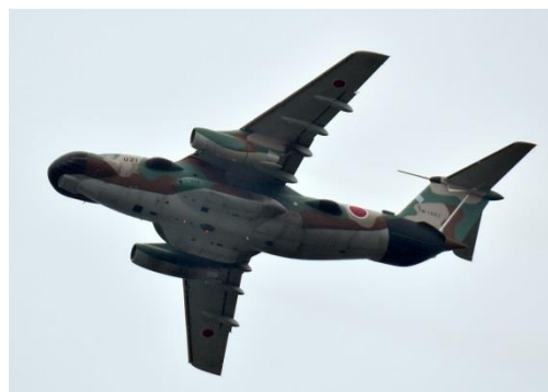
自衛隊—37 航空自衛隊 U-4 多用途輸送機 (入間基地) 2016年8月5日撮影