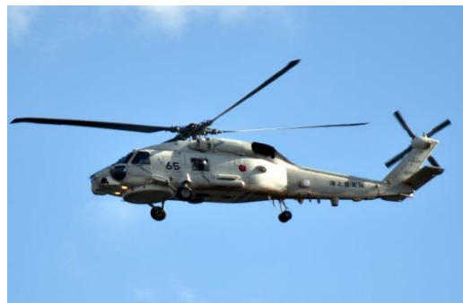
自衛隊—17 海上自衛隊 SH-60K 哨戒ヘリ 2016年3月15日撮影