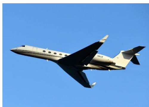
米軍－63 米空軍 C－37B 高官輸送機 ガルフストリーム 2023年5月31日撮影