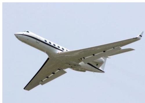
米軍－62 米空軍 C－37A 高官輸送機 ガルフストリーム 2020年10月14日撮影